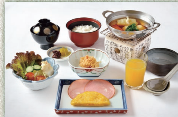
B ロールキャベツスープ仕立て オムレツ/ハム 小鉢(お浸し) 季節のサラダ/ポテトサラダ添え ご飯/漬物/みそ汁/ジュース