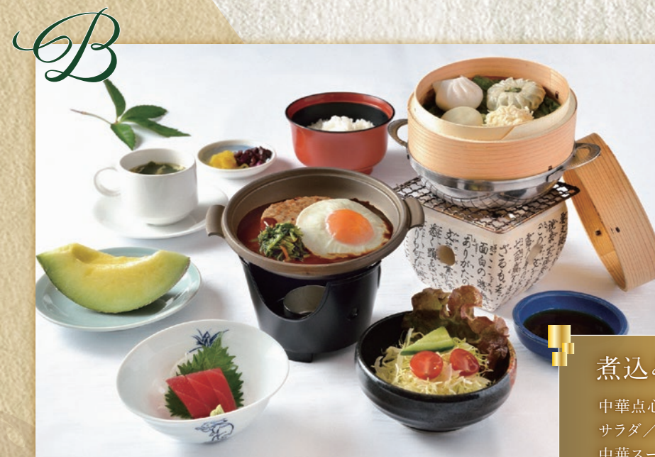
B 煮込みハンバーグ 中華点心/まぐろ造り サラダ/ご飯/ 中華スープ/フルーツ