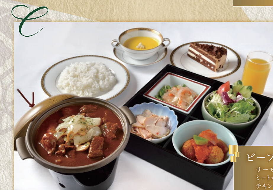
C ビーフストロガノフ サーモンマリネ/ ミートポークトマト煮/ チキンマリネ/サラダ/ スープ/ライス/ ケーキ/ジュース