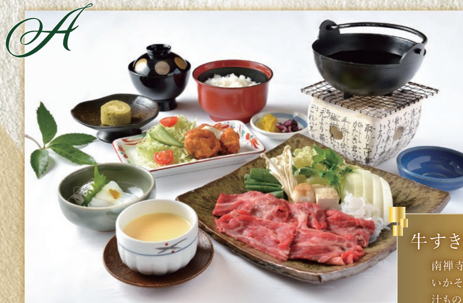
A 牛すき焼き鍋 南禅寺蒸し/チキン南蛮サラダ いかそうめん/ご飯/漬物 汁もの/デザート