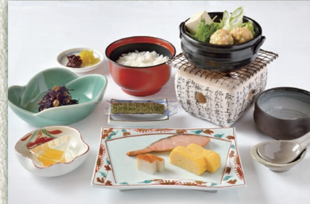
A 味噌ちゃんこ鍋仕立て/鶏つくね、各種野菜 鮭塩焼き/かまぼこ、玉子焼き 小鉢にて煮物 ご飯/漬物/海苔/デザート