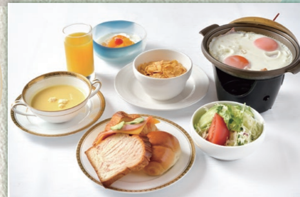
C ベーコンエッグ/ポタージュスープ コーンフレーク/ オープンサンド/ロールパン/ フルーツヨーグルト/ジュース